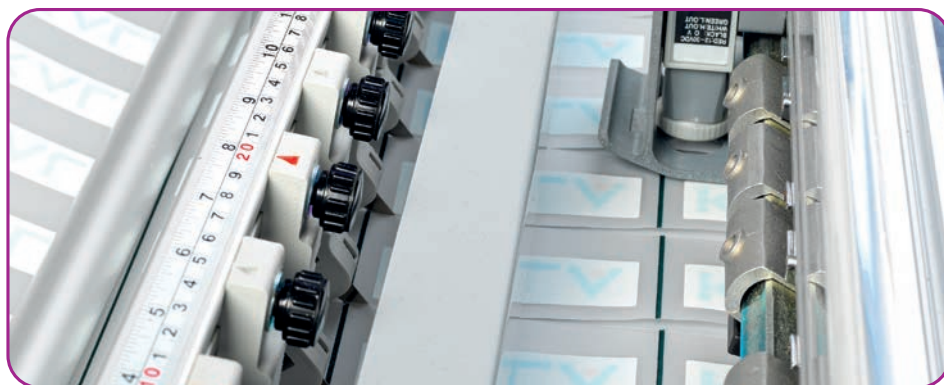
Jeu de lames Y en place sur la machine