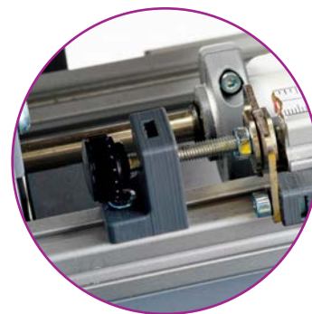
Molette de réglage pour l'ajustement du set complet de lames Y sur le média