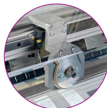
Lame de coupe X auto-affûtante

Un arrêt automatique, intéressant pour les coupeuses installées en ligne avec une imprimante, peut être généré avec l'insertion de marques d'arrêt lors de l'impression avec ou sans RIP.