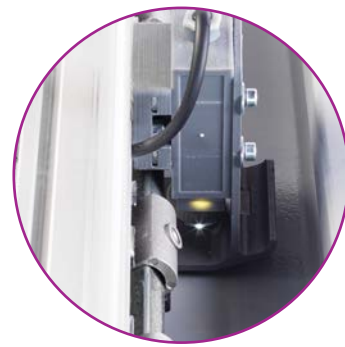
Capteur pour la détection des repères de coupe