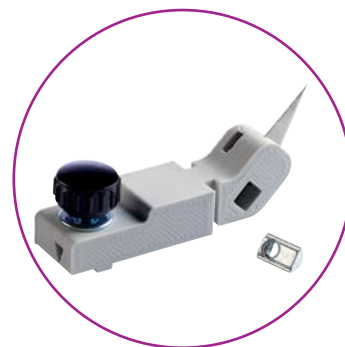
Support de lame Y

Des barres support de lames peuvent être commandées séparément pour avoir à portée de main l'outil de coupe Y complet et prêt à travailler selon le format.