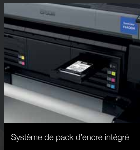
Système de pack d'encre intégré