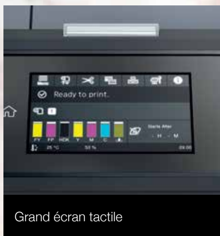
Grand écran tactile